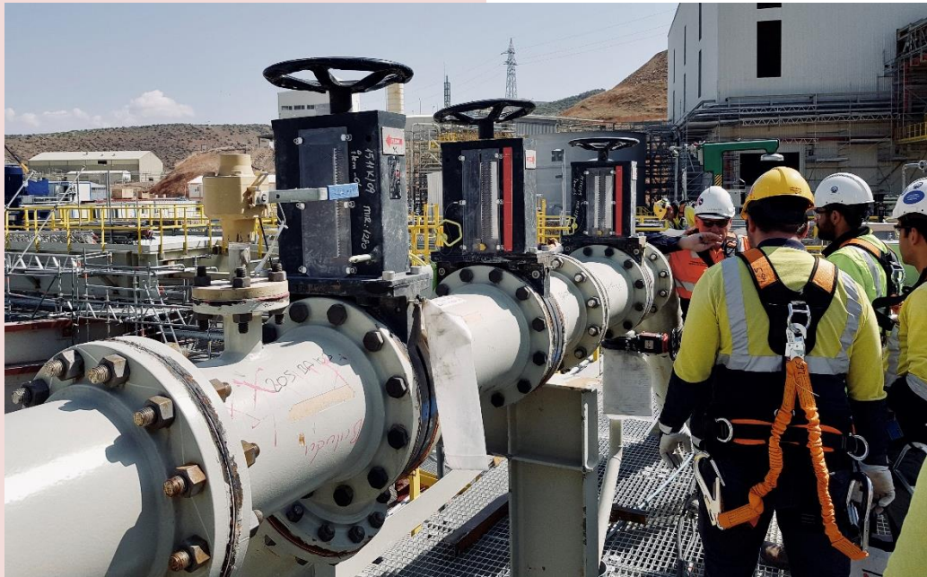
Das Sistag-Team vor Ort in der Çöpler Mine