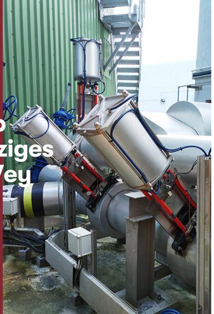
Wey Plattenschieber MFC DN 300 im Aussenbereich der Anlage.

Die installierten Wey Plattenschieber sind seit 2018 im Einsatz und funktionieren zuverlässig. Kunde und Betreiber sind sehr zufrieden und das Projekt O·PARK1 ein voller Erfolg. Die Bioabfallbehandlungsanlage bildet einen wichtigen Schritt auf dem Weg zu Hongkongs angestrebter CO 2 -Neutralität im Jahr 2050.