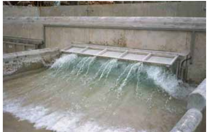
HydroSelf Schwallspülung für Rechteckbecken, Rundbecken, Kanäle