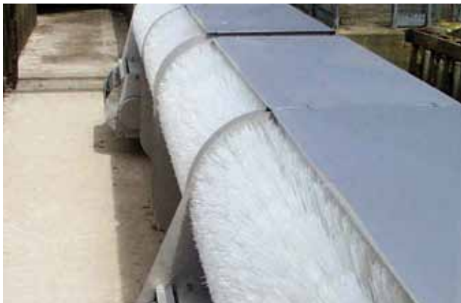
HydroClean Bürstenrechen Selbstreinigender Bürstenrechen für Entlastungsbauwerke ohne Fremdenergie