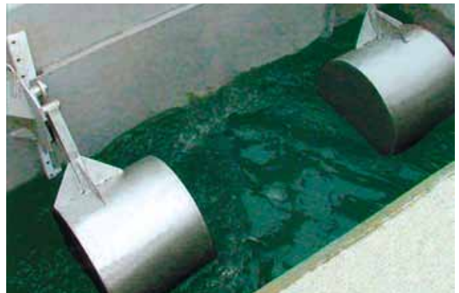
HydroStyx Abflussbremse Verzögert den Abfluss und aktiviert ungenutztes Speichervolumen in den Kanalnetzen