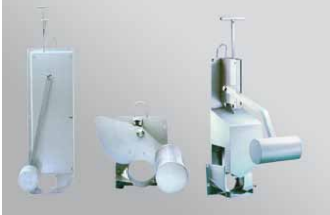
HydroSlide Abflussregler für alle Einsatzbedingungen ohne Fremdenergie